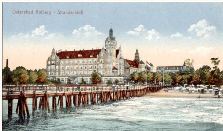
Widok z mola na Pałac Nadbrzeżny przed 1939 r.

Ważnym czynnikiem rozwojowym kołobrzeskiego kurortu była kolej, która dotarła nad Parsętę w 1859 roku. Ale jeszcze ważniejsza była likwidacja twierdzy w 1872 roku. Tereny forteczne wykupiło miasto. Rozpoczął się proces niwelacji fortyfikacji, rowów i zapór. W mieście zaczęto sadzić zieleń. Kołobrzeg nabierał kształtów prawdziwego kurortu. Powstawały kolejne inwestycje: molo, kąpieliska: damskie, męskie,