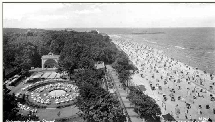
Widok z Pałacu Nadbrzeżnego na muszle koncertową i plażę.

W Kołobrzegu regularnie inwestuje się w bazę zabiegową, w powstawanie nowych miejsc sanatoryjnych i sanatoryjno-wypoczynkowych, ale także powstają nowe przedsięwzięcia uatrakcyjniające pobyt w nadbałtyckiej Perle Bałtyku. Uzdrowisko, to nie tylko odnowa biologiczna i rekreacja. To także kultura na wysokim poziomie i rozrywka. To właśnie te aspekty sprawiają, że Kołobrzeg stał się polską stolicą SPA.