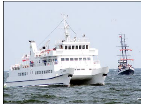
Kołobrzeg 7.00 Nexø 11.30; Nexø 18.00 Kołobrzeg 22.30

dynawii Bogu zostały resztki tych wszystkich cudowności, które dał krajom Północy. Bóg te resztki zebrał i rzucił do Bałtyku- tak powstał Bornholm”. W lipcu i sierpniu armator Kołobrzewska Żegluga Pasażerska planuje rejsy codziennie: