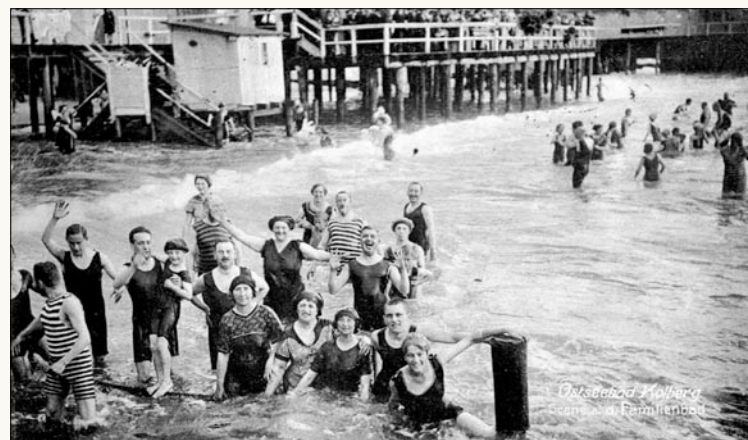
Kąpielisko Rodzinne, okres międzywojenny.

światowa. Działania militarne spowodowały spadek liczby kuracjuszy. Prawie 30 pensjonatów zostało zamienionych w lazarety. Dwudziestolecie międzywojenne to okres przemian. Nowe obyczaje i nowa moda zmieniły dotychczasową panoramę plaży. Zmienił się także krajobraz samego miasta. Zostały rozbudowane przedmieścia, zwiększyła się liczba mieszkańców, ale także kuracjuszy, którzy licznie przybywali do kurortu pierwszej kategorii. Wybuch II wojny światowej wpłynął na stagnację w uzdrowisku. Na początku lat 40-tych zaczęła spadać liczba kuracjuszy. Wreszcie, miasto ogłoszono twierdzą. W wyniku walk w marcu 1945 roku kurort został poważnie zniszczo-